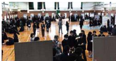
市役所職員・FW 訪問先企業・保護者の方も招いての校内発表会