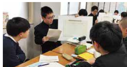
2年生探究論文発表会