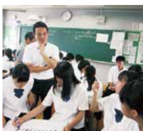
福井市役所による市政出前講座や地域の方々を招いての中間報告会