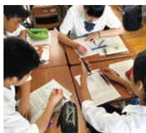
新聞記事を通して情報収集

「プロジェクト学習」(Project Based Learning 略して PBL)とは、生徒自身が情報を集め、仲間たちとともに考え、議論し、表現すべきことをまとめていく学習です。市政出前講座やフィールドワークなどを通して解決すべき課題を設定し、最終的には地域の方々に解決策を提案する活動を行っています。また、一昨年7月に香港 The ELCHK Yuen Long Lutheran Secondary School と姉妹校提携を結び、PBL を中心とした 国際協働学習 を始めました。こうした学習を通して、本校では「USUI 7」を軸とした、 これからの社会を生き抜くための資質・能力 を伸ばしています！