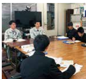
チームごとにフィールドワーク (FW)