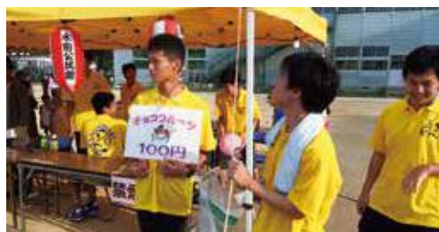
PBLでお世話になった公民館でのイベントに参加