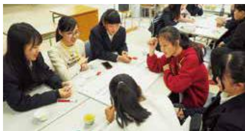
香港姉妹校との交流活動